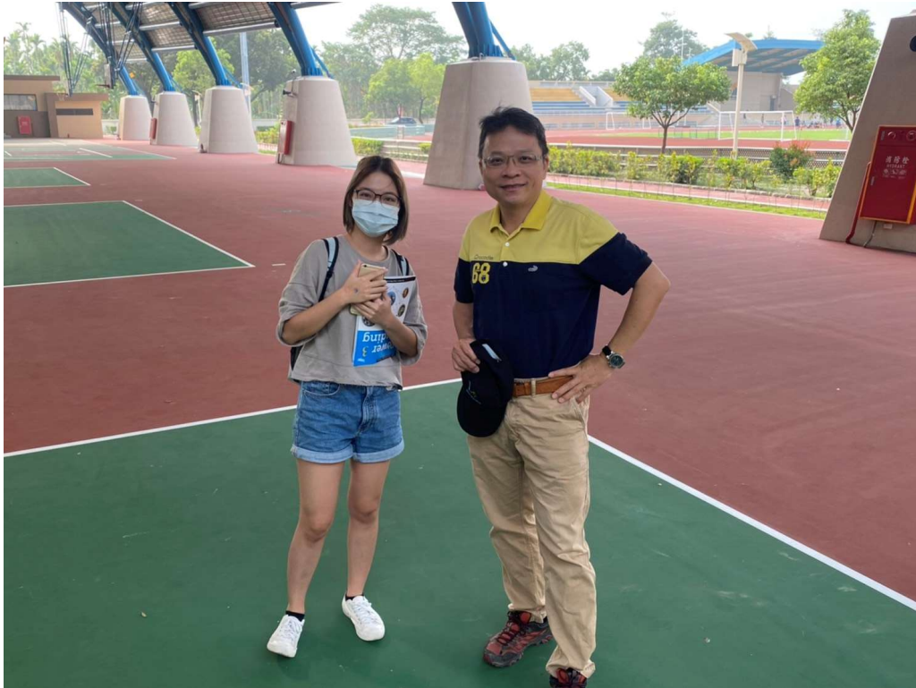
(圖為系學會同學與總務長在風雨球場合影)