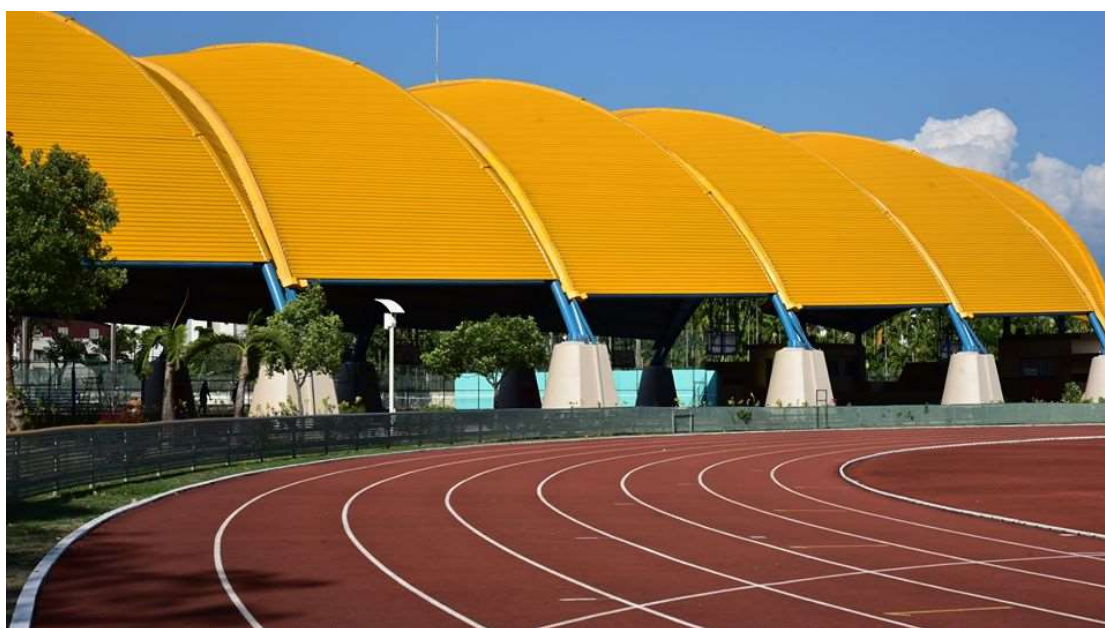
(此圖為風雨球場外觀)

A: 學校不只是學生的上課場所，更是周遭民眾的休閒中心，所以鼓勵無論校內外的人士，都可以多多利用我們的風雨球場。